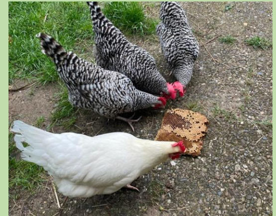
Hühner picken Drohnenwaben aus (Eiweiß)