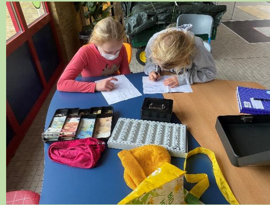
... machen „Kasse“