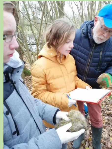
Zusammen mit dem Nabu werden drei Mal im Jahr die Nistkästen auf Theos Wiese kontrolliert.