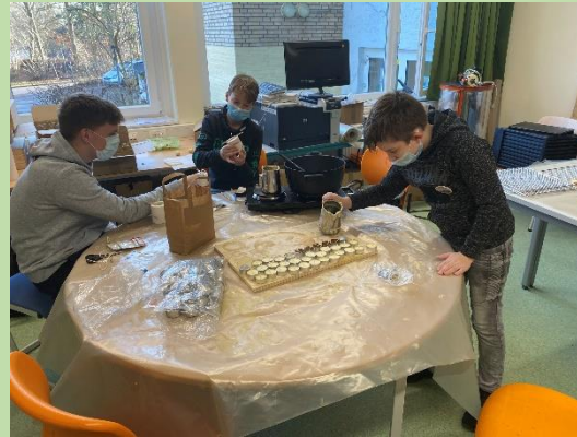
... gießen von Kerzen aus unserem eigenem Bienenwachs