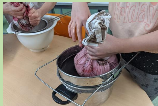
... Kinder der 6b pressen Saft für Flieder- beersirup