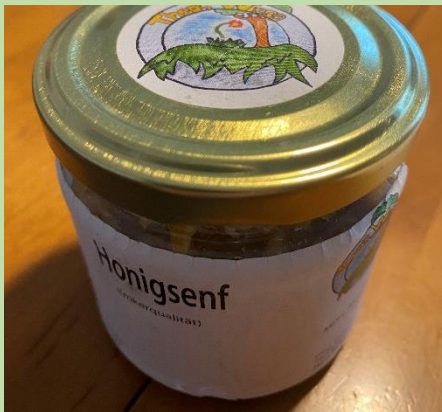
... wir stellen z.B. Honigsenf her, und anderes rund um unseren Honig