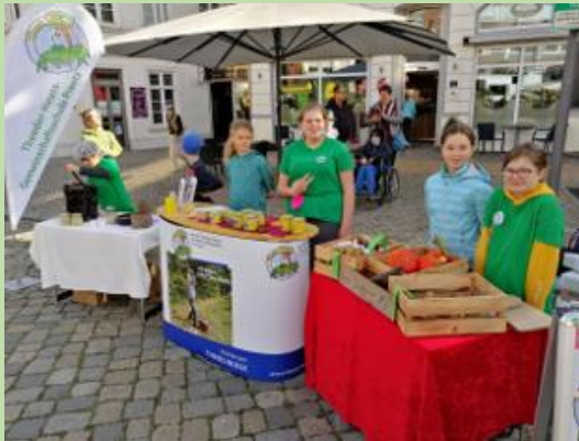
Verkauf Markttag am Quellstein in Preetz

Profilzweig THEOS WIESE an der Theodor-Heuss-Ge- meinschaftsschule Preetz