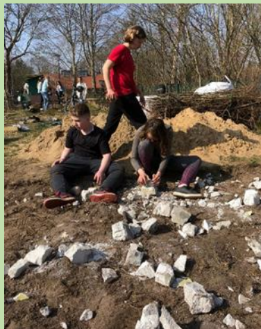
... SchülerInnen einer 7. Klasse legen einen Schmetterlings- und Insektengarten an ....