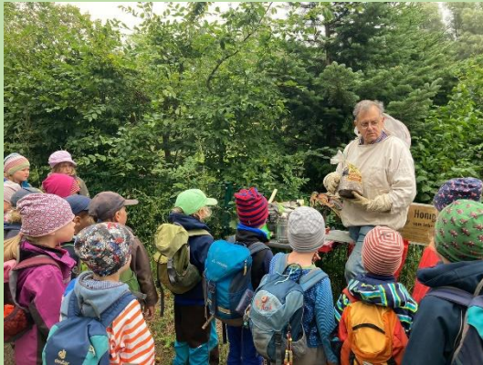
Imker Boppel hat Besuch vom Draußen-Kindergarten die Wühlmäuse und er erklärt und veranschaulicht über Bienen

Profilzweig THEOS WIESE an der Theodor-Heuss-Ge- meinschaftsschule Preetz