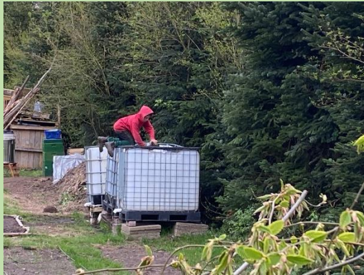
Henning repariert die Wasserpumpe

Profilzweig THEOS WIESE an der Theodor-Heuss-Ge- meinschaftsschule Preetz