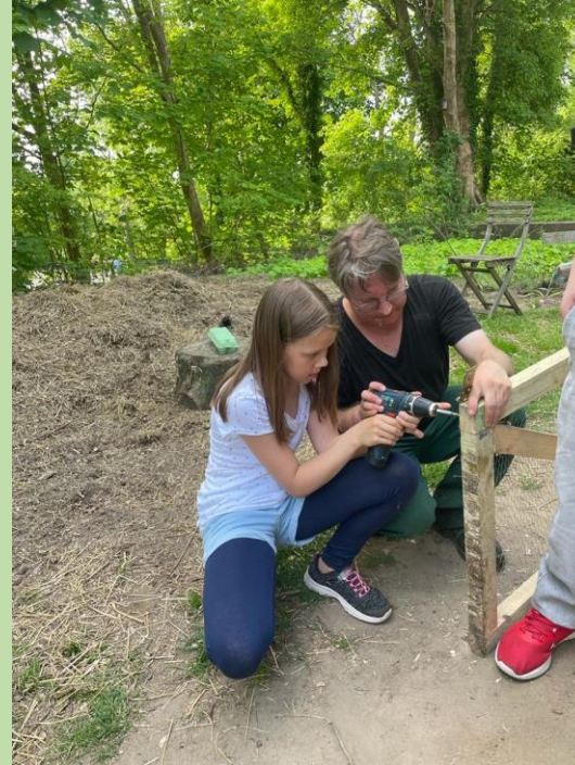
... der Hühnerstall wird repariert, dazu lernen wir bohren ...