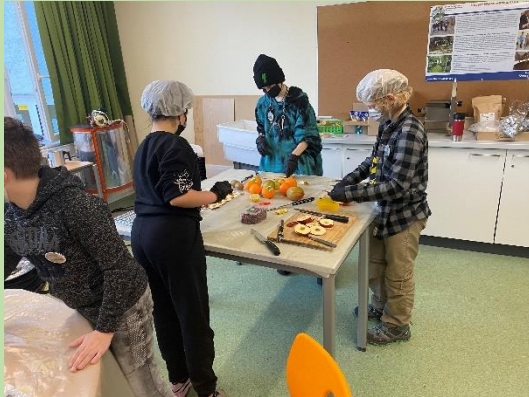
... Schnibbeln von Trockenobst

Profilzweig THEOS WIESE an der Theodor-Heuss-Ge- meinschaftsschule Preetz