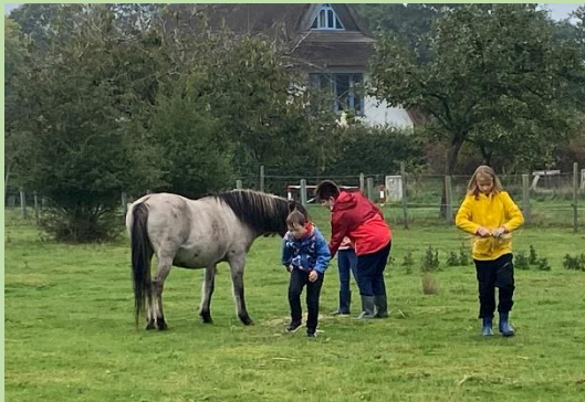
Kinder mit besonderem Förderbedarf von der Schule am Kührener zu Besuch bei uns