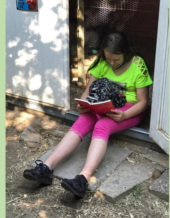
... ein Buch über Hühnerhaltung wird studiert ...