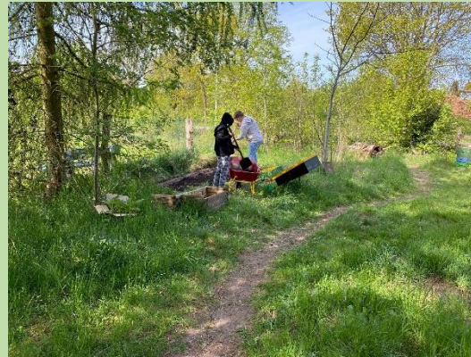
... Anlegen eines Beetes für Salatgurken, zur Herstellung von Honiggurken