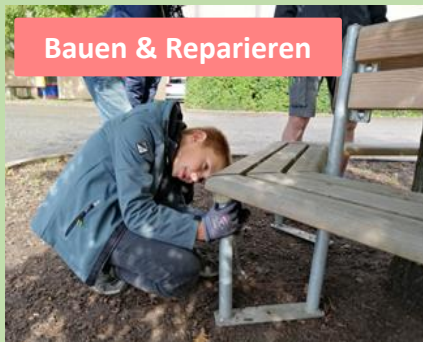
Bauen & Reparieren

Profilzweig THEOS WIESE an der Theodor-Heuss-Ge- meinschaftsschule Preetz