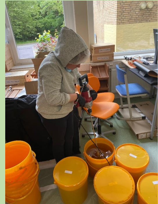
... Mine rührt frisch gerernteten Honig cremig