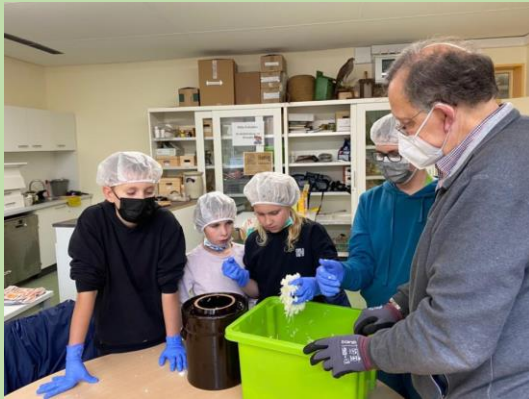
Wir machen Sauerkraut ....

Profilzweig THEOS WIESE an der Theodor-Heuss-Ge- meinschaftsschule Preetz