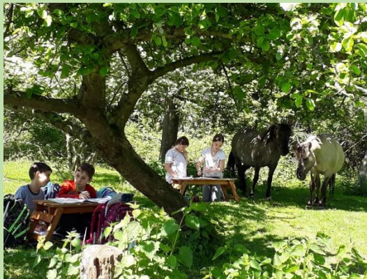
... wir machen Hausaufgaben mal anders auf einer Tierkoppel