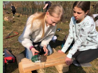
... und bohren und sägen für die Beetumfriedung