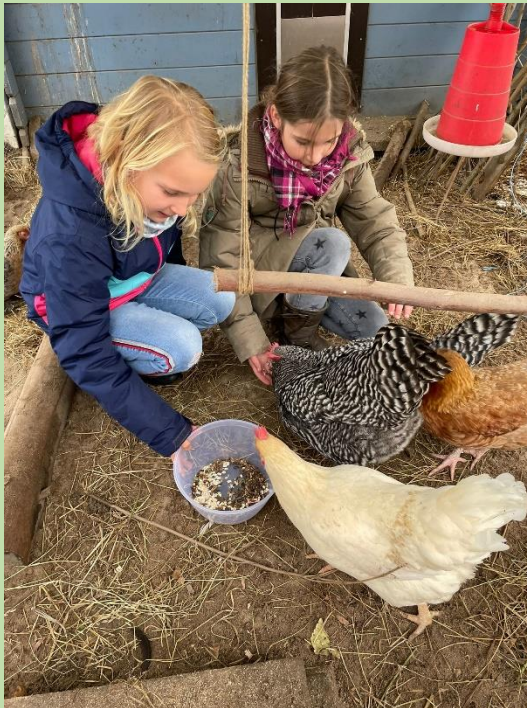
Hühner müssen täglich gefüttert und versorgt werden

Profilzweig THEOS WIESE an der Theodor-Heuss-Ge- meinschaftsschule Preetz