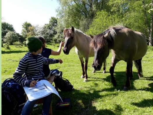
Aufgaben rund um Pferde und Tier- haltung werden erledigt ...

Profilzweig THEOS WIESE an der Theodor-Heuss-Ge- meinschaftsschule Preetz