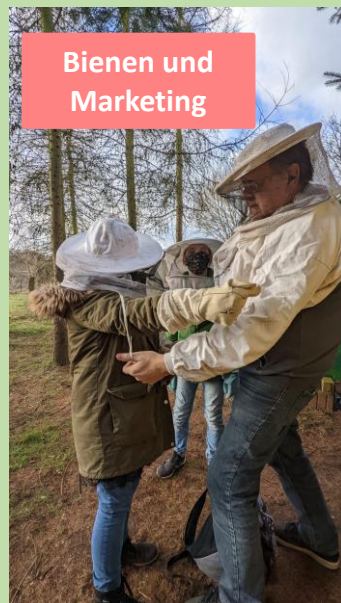
Bienen und Marketing