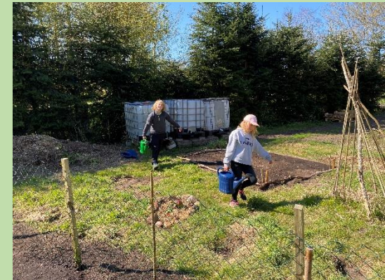
... phasenweise war es trocken und im Garten musste viel gegossen werden