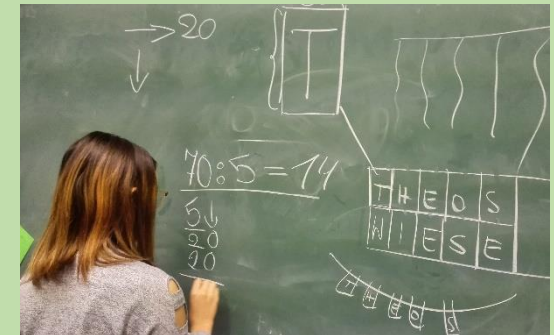
Wir rechnen, um ein Schild zu bauen.