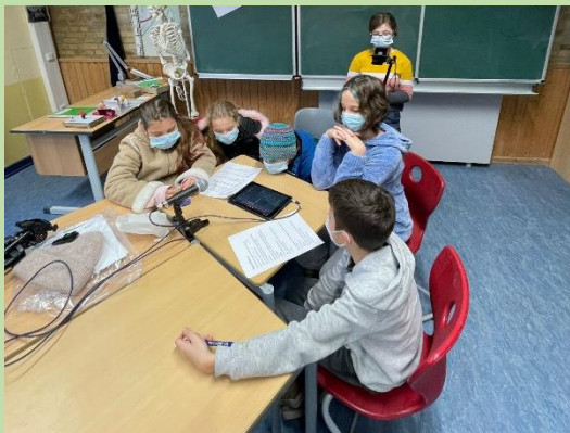
... hier wird ein Hörspiel aufgenommen