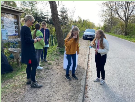
Verkauf direkt an unserem Garten