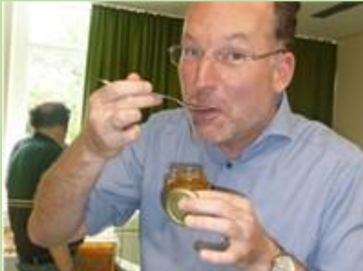
Bürgermeister Demmin beim „Honigmachen“

Profilzweig THEOS WIESE an der Theodor-Heuss-Ge- meinschaftsschule Preetz