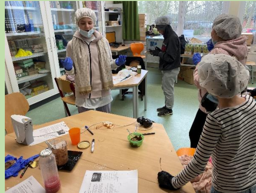
... hier wird „Honig-Nutella“ hergestellt und probiert