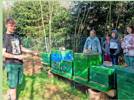
... Bundesfreiwilliger mit der Imkergruppe beim Imkern