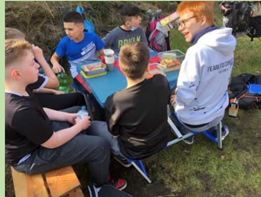
... Pause für Gartenarbeiter