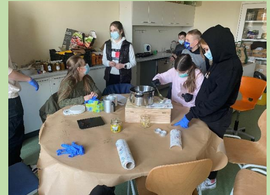
... Herstellung von Salben aus eigenem Bienenwachs und Honig