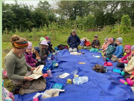
... ein andermal: die Wühlmäuse sind bei uns im Garten und frühstücken selbst selbst gebackenes Brot, Honig aus der Wiesenimkerei und selbstgemachte die WiesenschülerInnen für den Besuch des Kindergartenkinder hergestellt haben ...