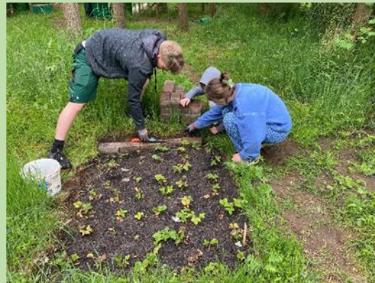
... unser BUFDi fasst mit Kindern ein Erdbeerbeet ein