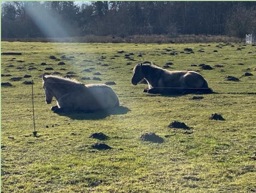
... unsere Koniks genießen die ersten Frühlingsstrahlen

Profilzweig THEOS WIESE an der Theodor-Heuss-Ge- meinschaftsschule Preetz