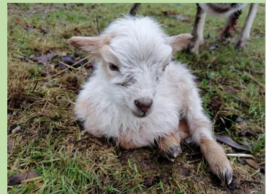
... frisch geborenes Lämmchen