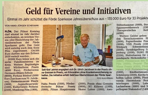
... und hier lesen wir, dass Theos vom Kreis Plön eine Geldzuwendung bekommen hat