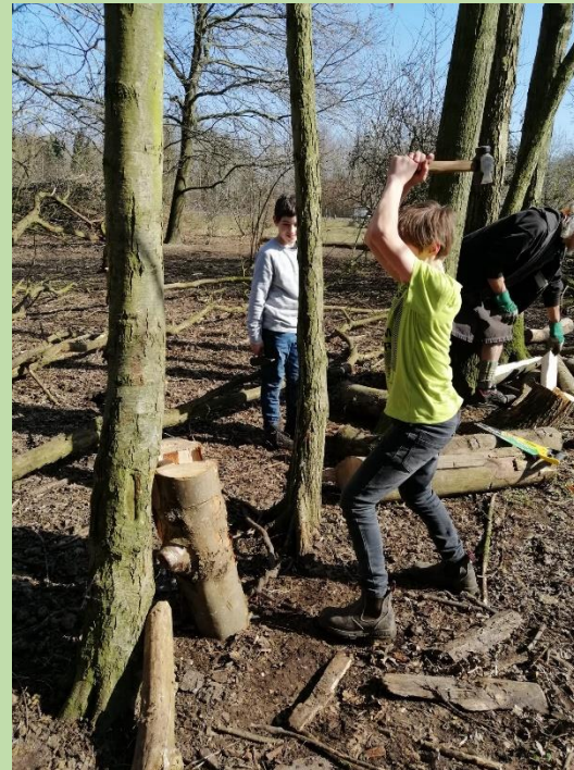
... Holz wird geschlagen und gespalten