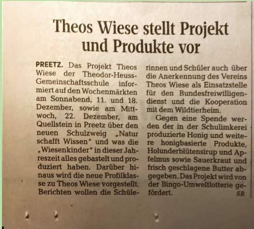
Öffentlichkeitsarbeit der marketinggruppe,

Profilzweig THEOS WIESE an der Theodor-Heuss-Ge- meinschaftsschule Preetz