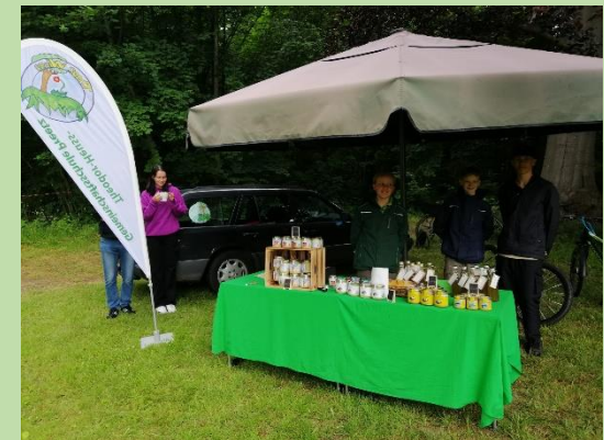
... beim Familientag Schloss Bredeneek und die Wiesen-Eltern sind mit von der Partie