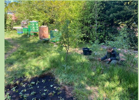
i-Kind beim Pflanzen einer Bienenweide