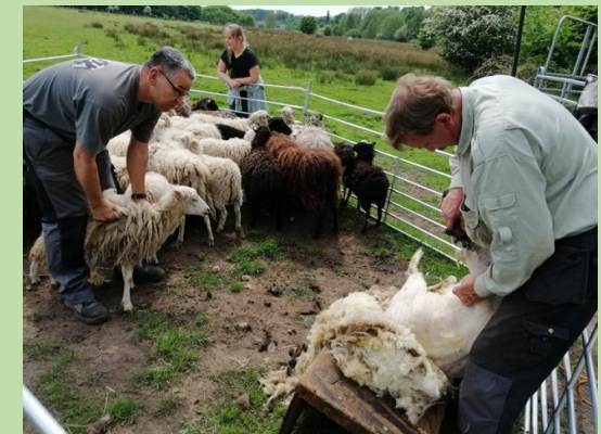
... Schafe werden geschoren